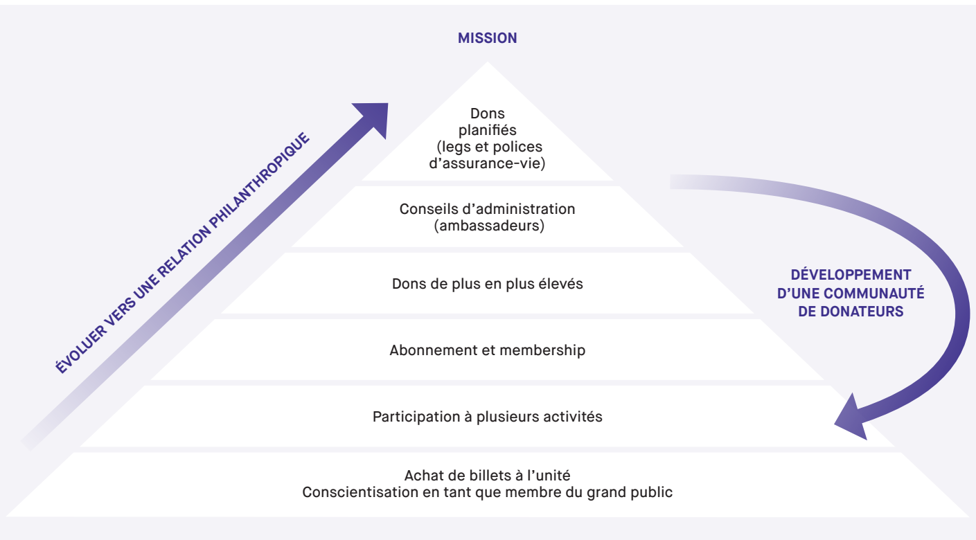
FIGURE 1 LA PYRAMIDE

Voici la pyramide qui décrit les étapes d'élaboration d'une relation philanthropique dans les organisations culturelles 24 [ VOIR FIGURE 1 ].